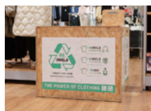
店内のリサイクルボックス