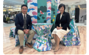
贈呈式には森岡館長(左)と末松理事長(右)が出席しました