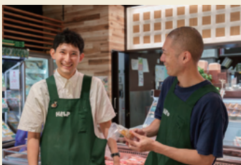
精肉担当の栗津店長(写真右)と