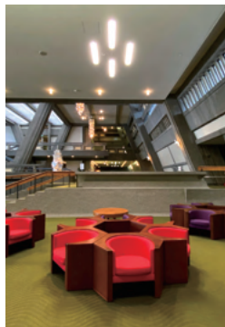
京都市左京区岩倉大鷲町422

半世紀、未来を語ってきた国内初の国際会議場。60年代モダンデザインに包まれたのならココ!台形と逆台形で組まれた宇宙基地のような建築ですが、比叡山の自然にも不思議と調和。日本の伝統的な稲掛け、合掌造りの民家、神明造の神社などを連想させてくれます。