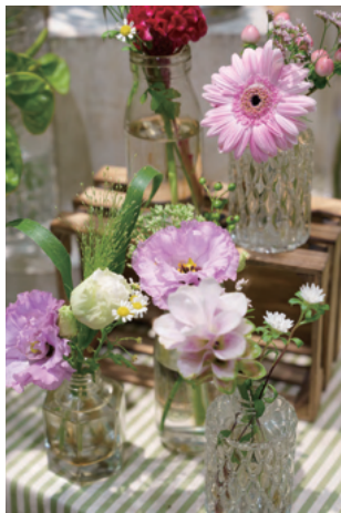
気まぐれフラワー 60日間/15回分チケット 2,200円(税込)

店頭や商品、スタッフが実際に取り組んでいることについてアンケートを実施。 たくさん回答があった中の一部を紹介します！