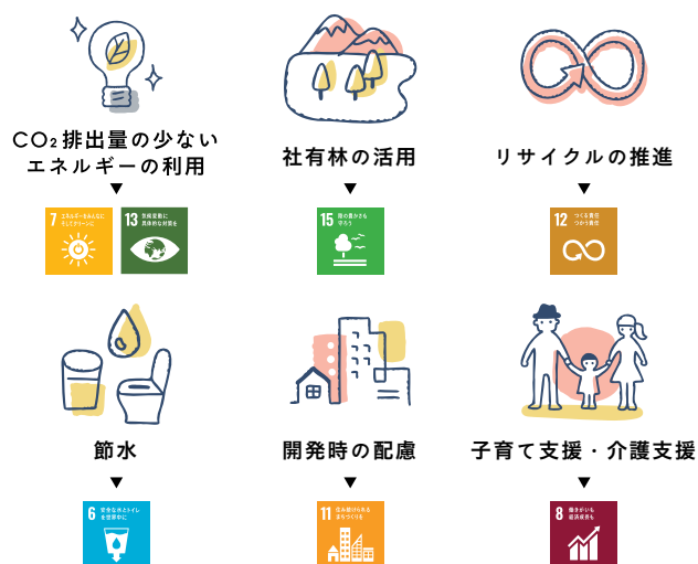
環境省「持続可能な開発目標(SDGs)活用ガイド第2版」から一部抜粋

SDGsが関係するのはグローバルな取り組みではありません。企業が行う事業そのものはもちろん、普段から取り組んでいる節電や節水、社員の福利厚生など、企業が行う行動すべてがSDGsとつながります。