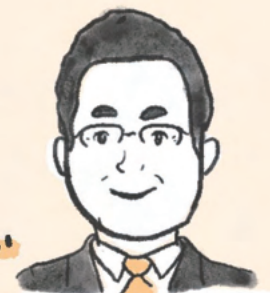
洛北阪急スクエア館長

いろいろな不安がある世の中 「居心地が良いから こへ行ってみようか」 と思ってもらえる商業施設でありたい