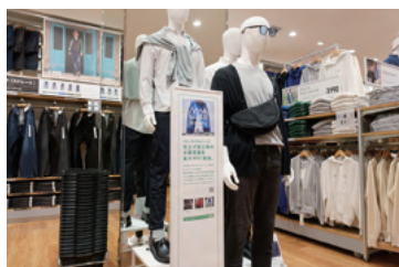
ジーンズは仕上げ加工時の水使用量を99%削減し、環境に配慮。3,990円(税込)~

ユニクロは全商品をリサイクル、リユースする取り組み「RE.UNIQLO」を進めており、難民キャンプなど、世界中の服を必要としている人たちに届けています。また、「届けよう、服のチカラ」プロジェクトでは店舗スタッフが小・中・高でSDGsや服のリサイクルについて授業を行っています。今年度は1学期に京都市立下鴨中学校、京都市立岩倉南小学校で実施しました。