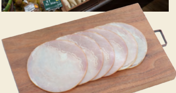
原材料が豚肉、食塩、砂糖、香辛料のみの ポークハムはヘルプのロングセラー商品 徳用ロースハム(ファミリーパック) 200g 388円(税込)