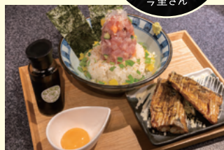
漁師めし 1,000円(税込) たれ唐 400円(税込) ※イベントでは漁師めしハーフ500円を販売します

京都市左京区吉田泉殿町1-95 TEL 075-754-0682 [営業時間] (火~木) 昼:11:30~14:30 / 夜:18:00~24:00 (金・土) 昼:11:30~14:30 / 夜:18:00~2:00 (日) 11:30~22:00 [定休日] 月曜日 [Instagram] @men.zacoya [Twitter] @menzacoya [Facebook] @men.zacoya