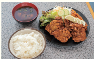
若鶏唐揚げ定食(4個のせ) 赤だし・ご飯付 860円(税込)

1960年の創業当時から変わらない「おふくろの味」をコンセプトを大切にしながら時代によって変わりゆく食生活や食文化に合わせた新メニューも楽しめる大衆食堂。