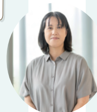
洛北阪急スクエア マルシェ担当