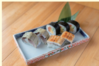
らくはん盛り 1,080円(税込) ※イベント限定