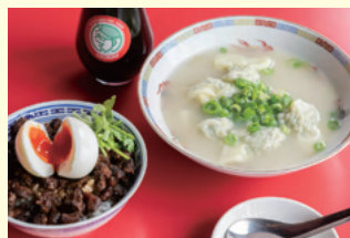
スープワンタン(6ヶ) 780円(税込) 魯肉飯 780円(税込)