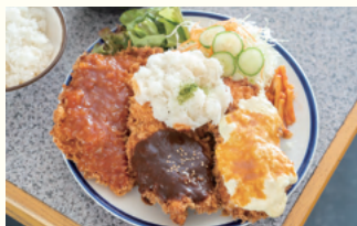
百万遍本店 限定 カラフルジャンボチキン カツ・ダブル 赤だし・ご飯付 1,460円(税込)