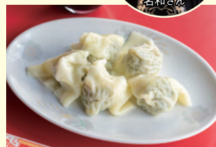
お持ち帰りメニュー ワンタン(8ヶ) 600円(税込)

京都市左京区田中里ノ内町82-1 藤川ビル2階 TEL 075-703-7870 [営業時間] 昼:11:30~14:30 (L.O. 14:00) / 夜:17:00~23:00 (L.O. 22:30) [定休日] 月曜日(臨時休業有り) [HP] https://wantanshop70.owst.jp/ [Instagram] @wonton70