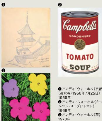
①アンディ・ウォーホル《京都(清水寺)》1956年7月25日(1956年) ②アンディ・ウォーホル《キャンベルのスープI: トマト》1968年 ③アンディ・ウォーホル《花》1970年

【会場】京都市京セラ美術館 新館「東山キューブ」 【観覧料】土日祝一般2,200円(2,000円) / 平日一般2,000円 (1,800円) / 大学生1,400円(1,200円) / 小中生800円(600円) ※( )内は8月17日(水)～9月16日(金)発売の前売り券の価格 【公式ウェブサイト】www.andywarholkyoto.jp/ 【公式SNS】@andywarholkyoto