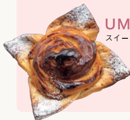
UMBER46 スイートポテトパイ