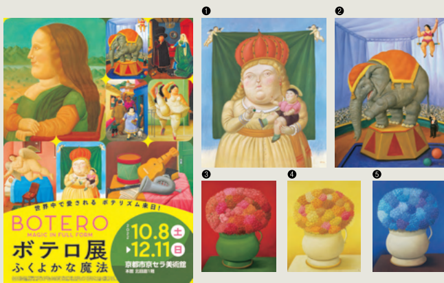
①アンディ・ウォーホル《京都(清水寺)》1956年7月25日(1956年) ②アンディ・ウォーホル《キャンベルのスープI: トマト》1968年 ③アンディ・ウォーホル《花》1970年

【会場】京都市京セラ美術館 本館 北回廊1階 【観覧料】土日祝一般・大学生1,800円(1,600円) 中学・高校生1,300円(1,100円) / 平日一般・大学生1,700円(1,600円) 中学・高校生1,200円(1,100円) ※( )内は9月2日(金)10:00～10月7日(金)23:59 発売の前売り券の価格