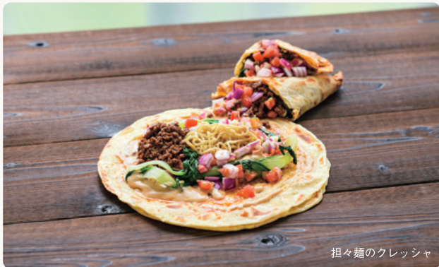
担々麺のクレッシヤ