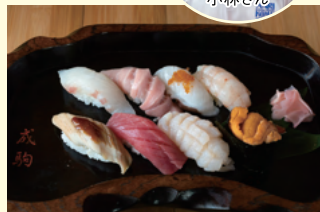
おまかせにぎり 3,900円(税込)

京都市左京区田中里ノ前町53 TEL 075-781-4611 [営業時間] 10:00~22:00 [定休日] 水曜日 [Instagram] @narikomashushi