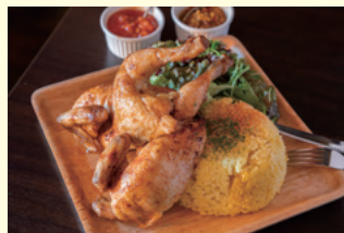
ギガトンチキンプレート 2,400円(税込)

専用ロティサリーオープンで焼き上げた 鶏の旨味を味わえるローストチキンの専門店。