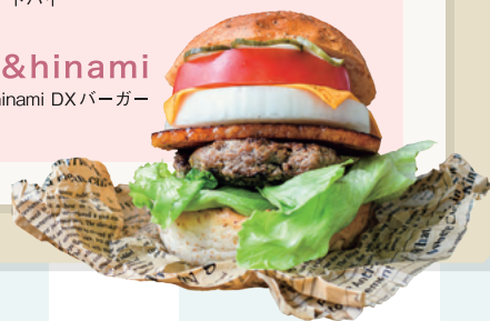
&hinami hinami DX バーガー