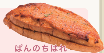
ぱんのちはれ 明太子ペロンチーノ