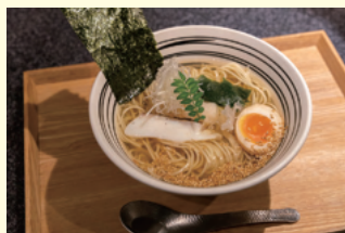
凜(塩ラーメン) 750円(税込)